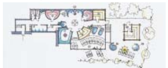
Dieses Beispiel zeigt eine Anlage auf ca. 200 m 2 , die eher für ein Kongresshotel gedacht ist. Sie umfasst Caldarium, Aromagrotten, Kalduschen und Eisbrunnen, Indoor- und Outdoor-Sauna sowie Whirlpools. Das Schwimmbad fehlt auf dem Plan. (Plan: Klafs Saunabau AG)