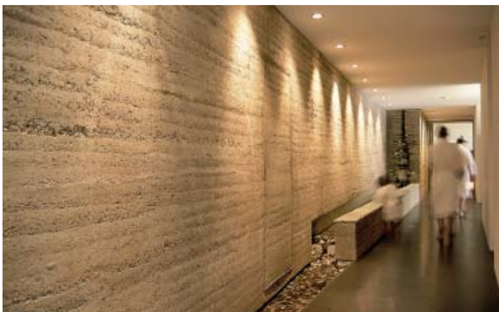
Im gemischten Saunabereich ist im grünen Kubus ein Aromabad untergebracht, im roten die finnische Sauna. Der Naturstein stammt aus Vals. Im Durchgang reguliert eine Stampflehmwand das Raumklima.