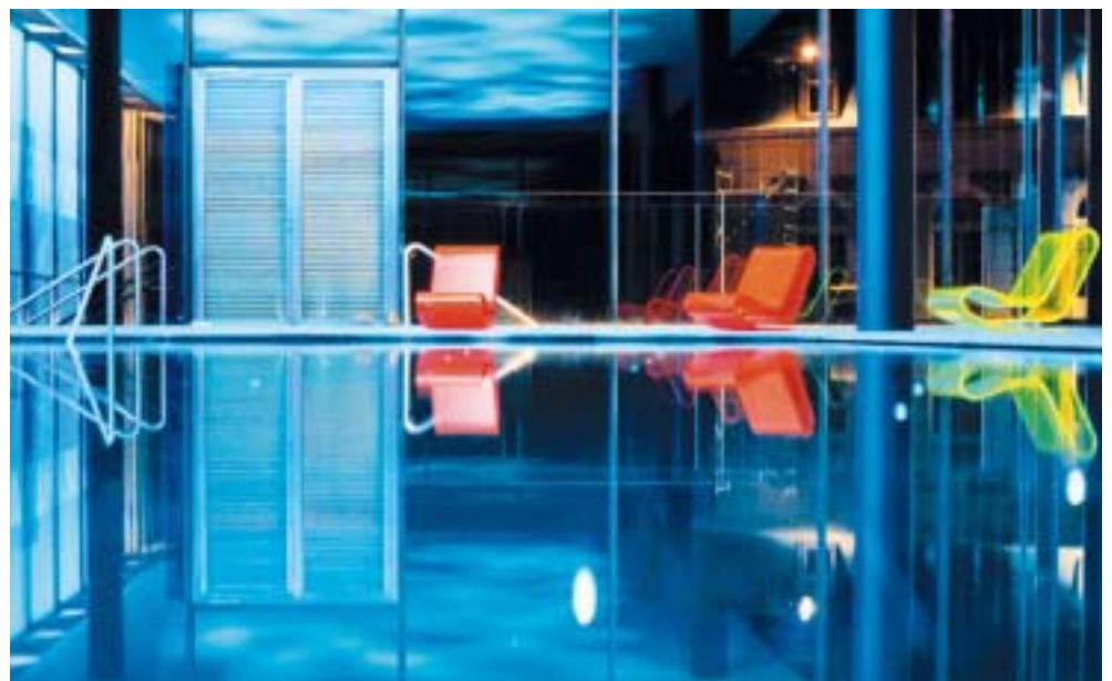
Das Innenschwimmbad bieten einen fast ungehinderten Blick ins Freie. (Bild unten: Architekten)