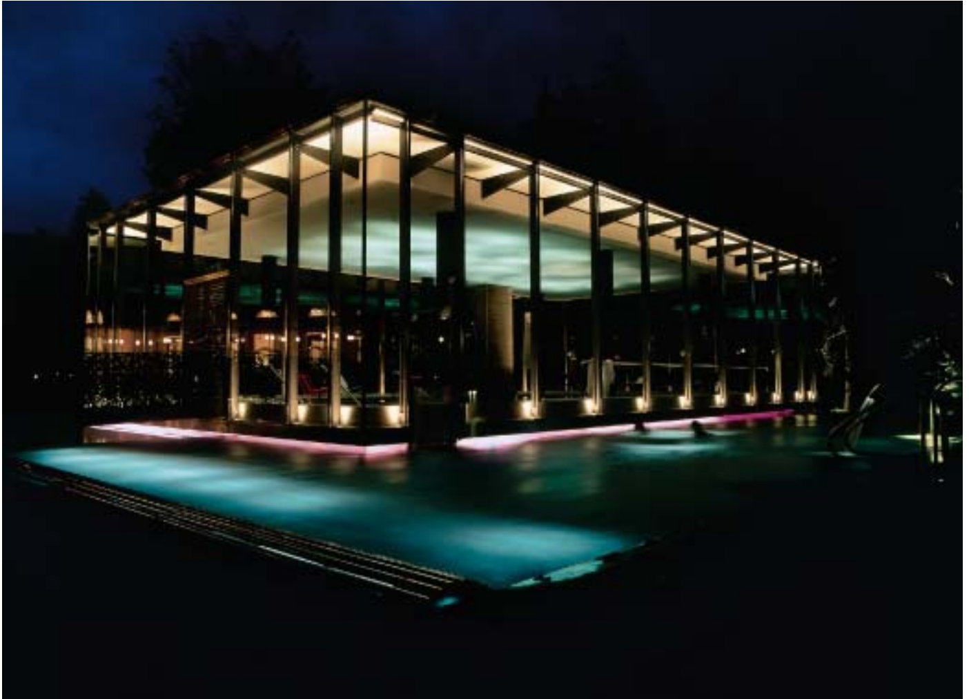
Dank raffinierter Lichtleitertechnik leuchtet der Glaskubus geheimnisvoll und scheint zu schweben.